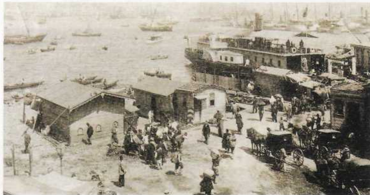
1870'li yıllarda Eminönü iskelesinin kalabalığı ve kıyıda, 'Suhulet' arabalı vapuru.

miş birer şikayet defteri koydurdu. Boğaz'da iskelesi olmayan köylere iskele binası yaptırmak üzere harekete geçti. Kabataş, Üsküdar, Mesarburnu (bugünkü